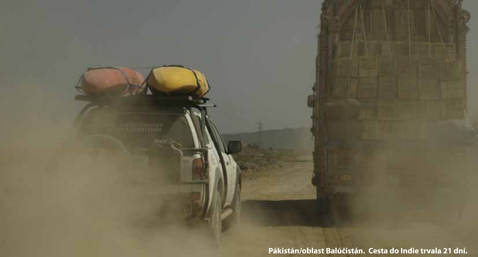
Pákistán/oblast Balúčistán. Cesta do Indie trvala 21 dní.

se narodil Honza Lásko, který se stal pro mne nejdůležitější postavou výpravy na Alaknandu v roce 2006. A právě s Honzou, který se stal jedním z nejlepších páddlerů na světě, jsme se na podzim 2007 vydali na naprosto neznámou řeku v Etiopii.“ vypráví Petr.